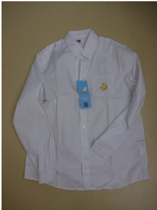
2#: 白色女士长袖衬衫