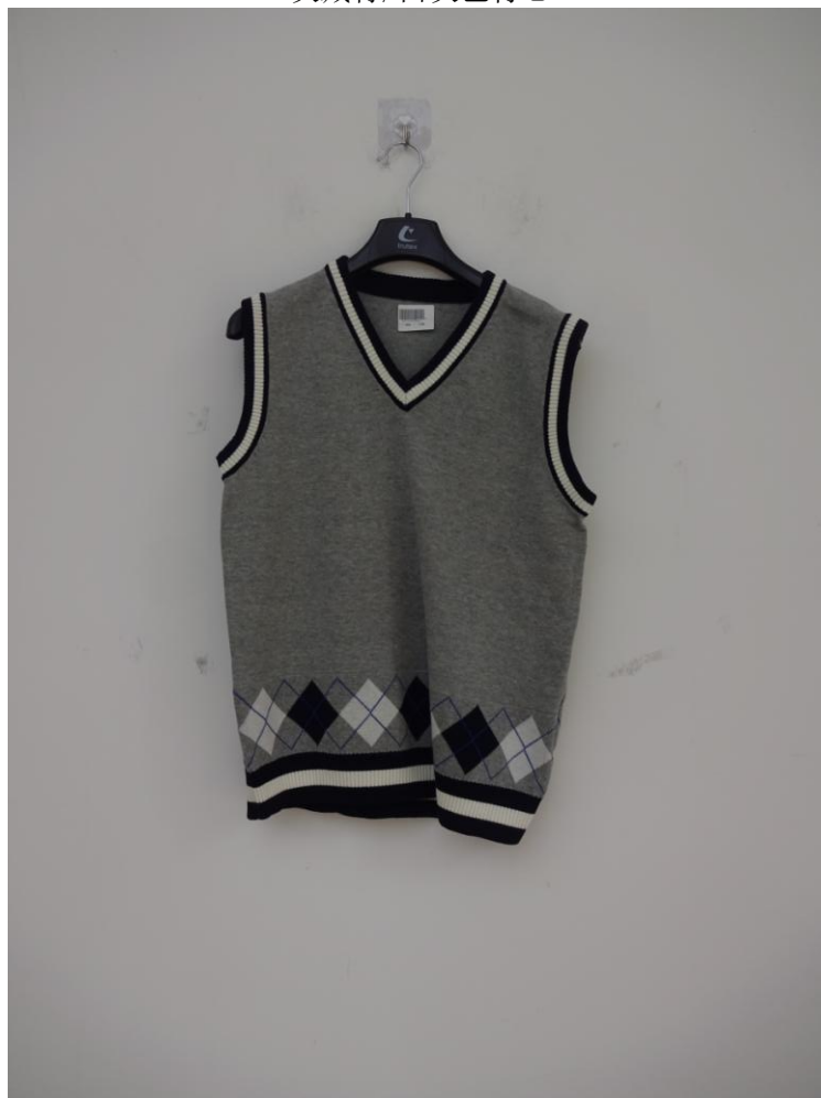
灰藏青/白灰色背心